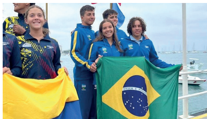
Seleção Brasileira vice-campeã geral do torneio.